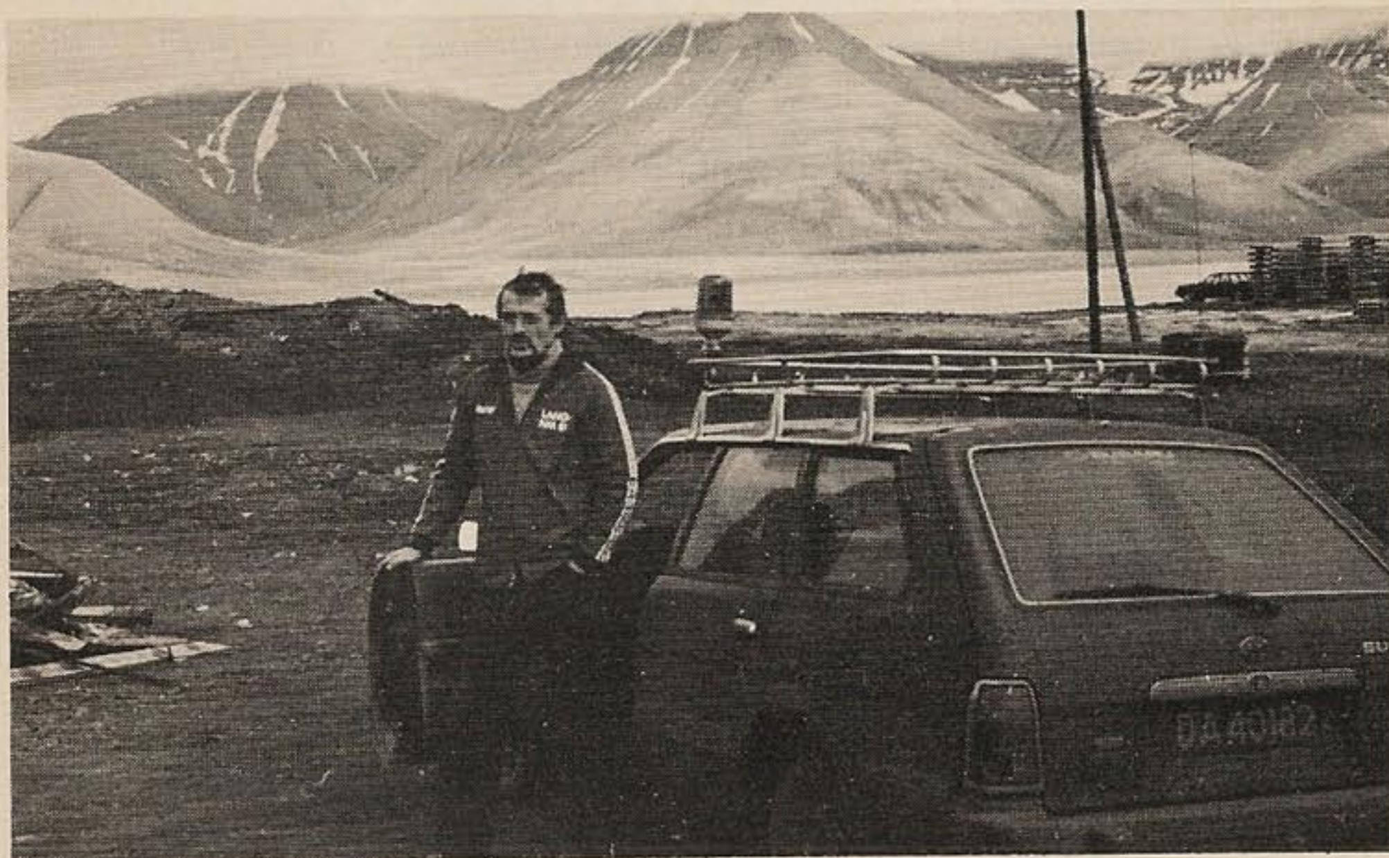
JW5NM, OM Math i Longyearbyen august 1981. Typisk Svalbard-landskap i bakgrunnen.

Europeiske og USSR stasjoner er absolutt de verste på båndene. De fleste av dem kaller både når de skal og mest når de ikke skal. JA-